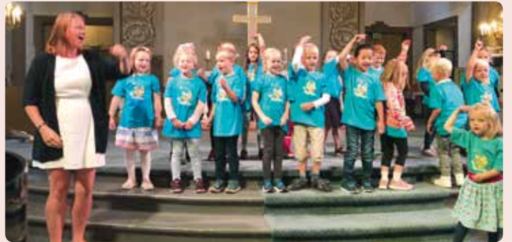
Glimt fra actiondagen: