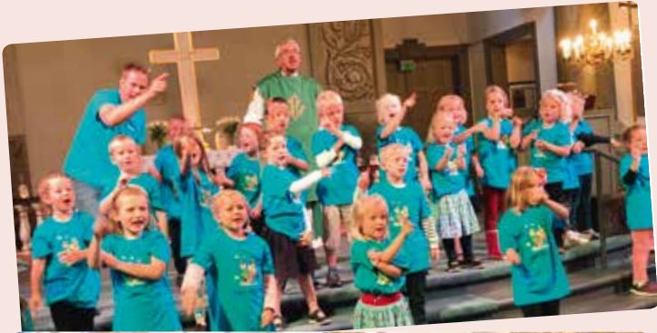
Glimt fra dåpsskolen i Mandal: